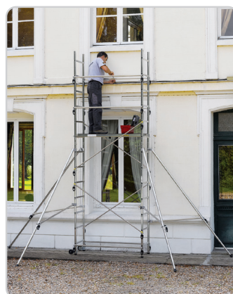
Speed'up XL hauteur du plancher 3 m